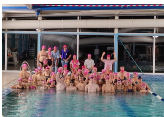
Photo rose du 16 octobre, rassemblant les porteurs de bonnets roses.

C'est avec beaucoup de plaisir que votre club préféré renoue avec un petit journal d'information adressé à tous ses adhérents... Il rappellera quelques souvenirs aux plus anciens même si nous utiliserons la technologie numérique pour cette nouvelle forme de communication. Et puis les enfants ne s'en plaindront pas non plus, eux qui ramenaient souvent à la maison une feuille de papier rendue in-